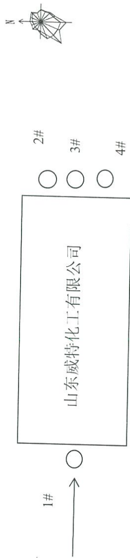
图 3-1 11月22日无组织废气检测点位分布图